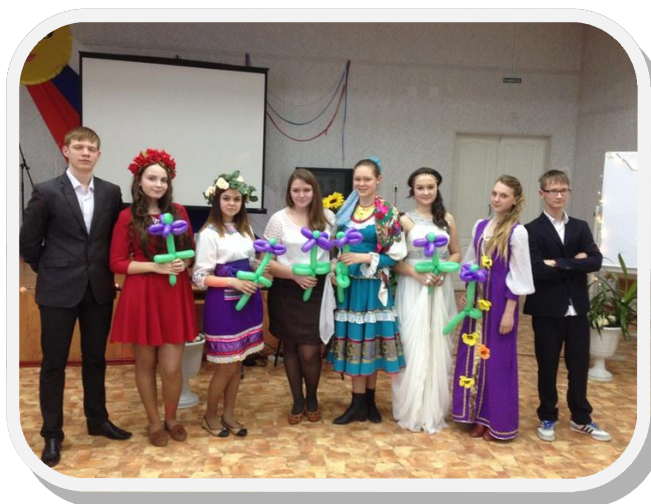
Участницы и ведущие конкурса «Мисс весна»